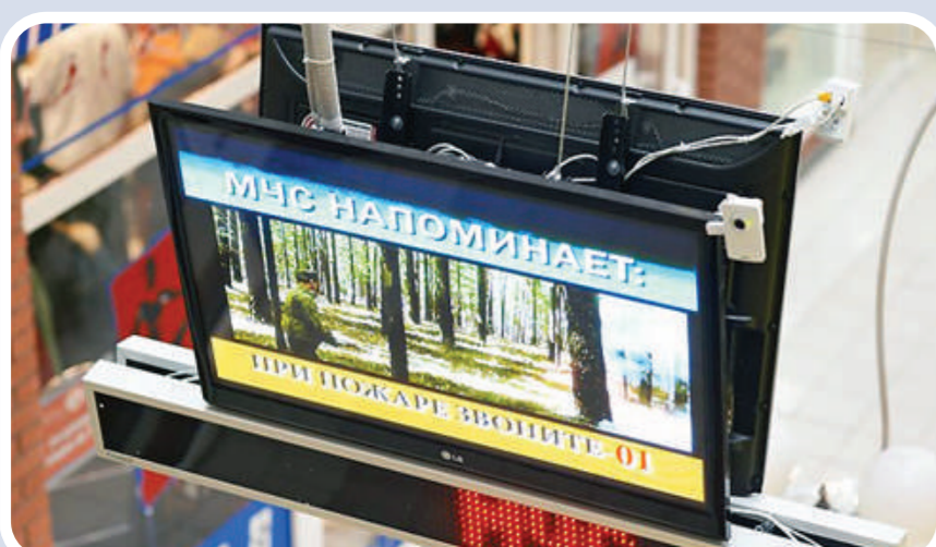
Пункт информирования и оповещения населения в зданиях с массовым пребыванием людей