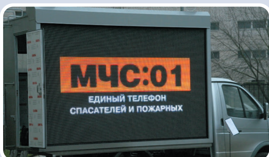
Мобильный комплекс информирования и оповещения населения