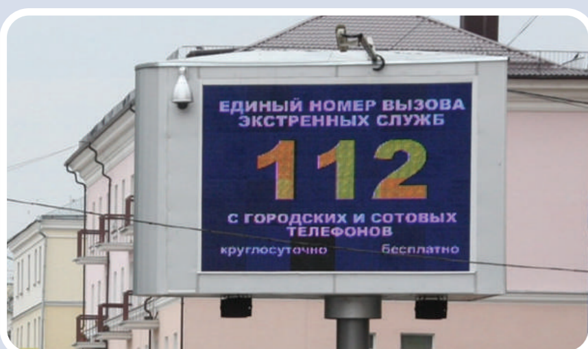
Пункт уличного информирования и оповещения населения